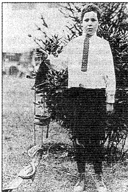
Lake spokane-i gyógyító otthonának egy páciense, egészségesen