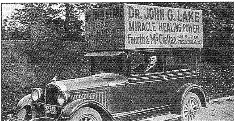
Úton... Az üzenet „lábrakelt”